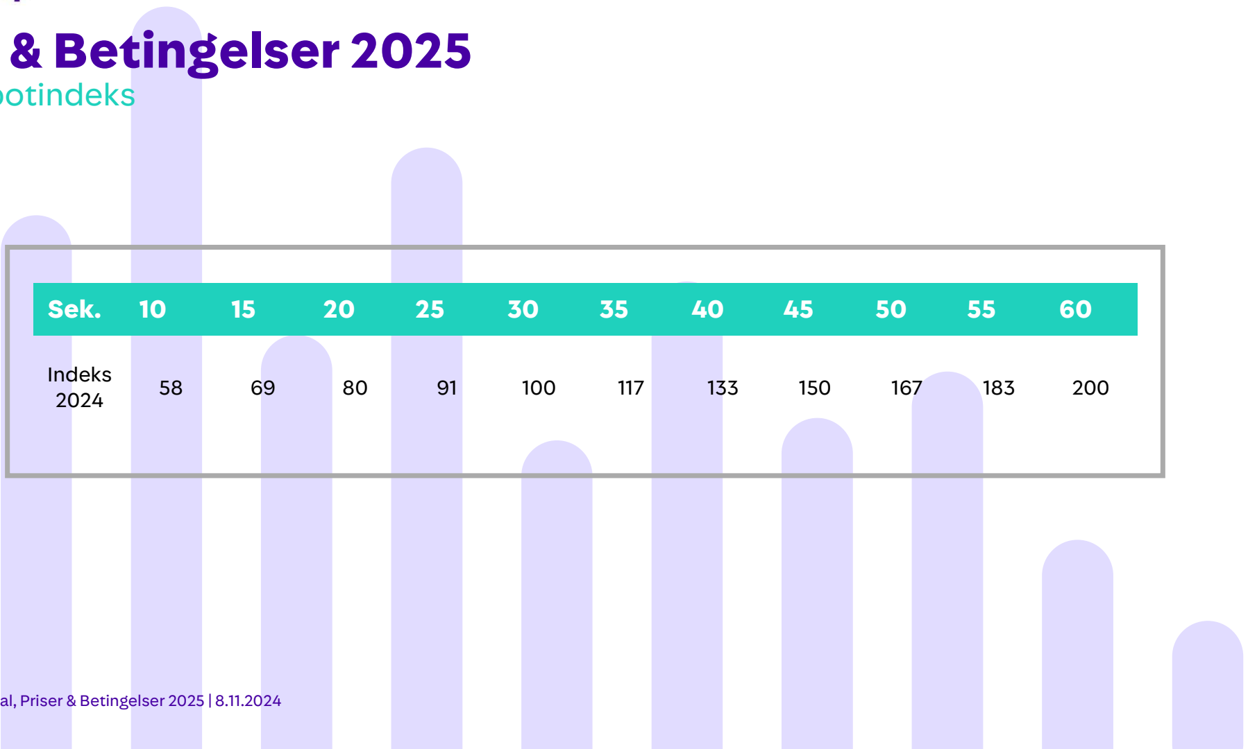
Figur 2, Spotindeks